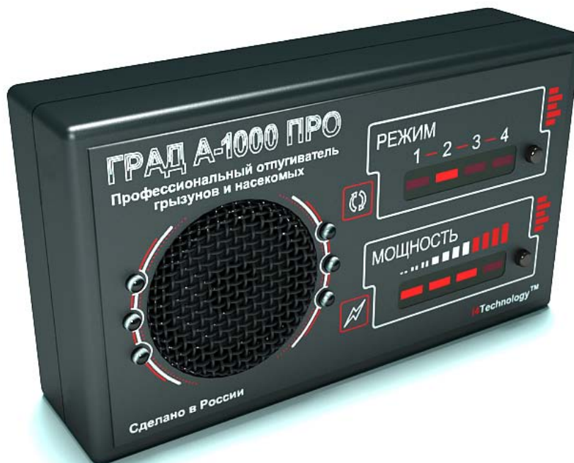
Рисунок 1 – внешний вид прибора